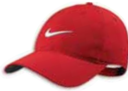
518015 University Red Rouge