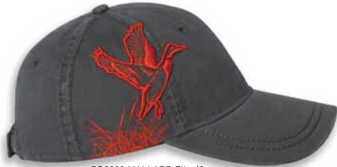
DD3308 MALLARD Flint/Orange Flint/Orange