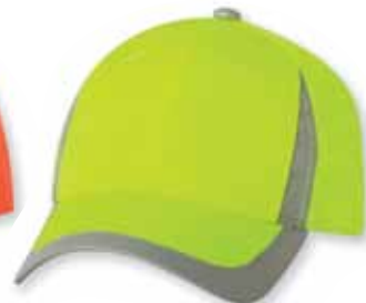
OSAF100 Neon Yellow Jaune Fluorescent