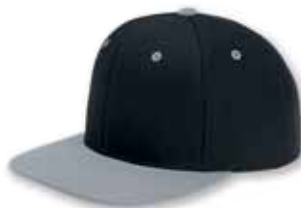
YU6089 Black/Silver Noir/Argent