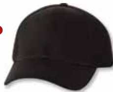
SP3200 Black Noir

Caractéristiques: 100% Coton Twill à l'avant, 6 panneaux, Profile Medium, Palette pré-courbée, Panneaux avants renforcés, Filet arrière 100% polyester; Attache avec Velcro, Grandeur Unique