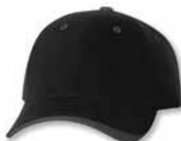
SP9960 Black/Charcoal Noir/Charbon