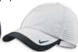
518023 White Blanc