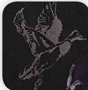
DD3522 MALLARD Detail