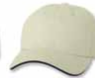
SP2100 Stone/Navy Pierre/Marine