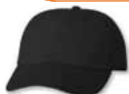
VC6640 Black Noir