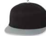
● ● FF6210 Black/Gray Noir/Gris