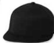
● ● FF6210 Black Noir