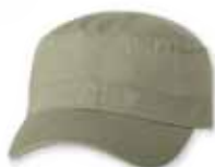
VC800 Khaki Kaki