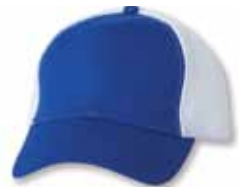
SP3200 Royal/White Royal/Blanc