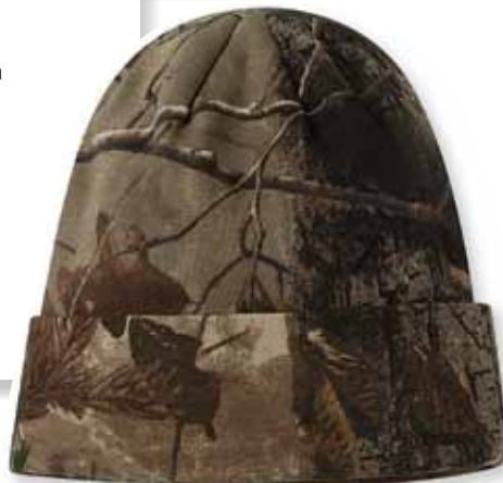
KLCB12 REALTREE All Purpose