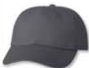
VC6640 Charcoal Charbon