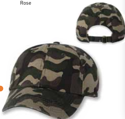
VC300CAM Green Vert