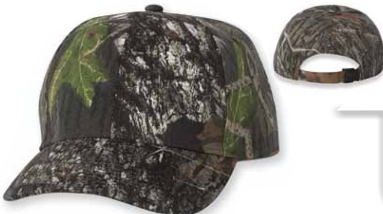
KM015 MOSSY OAK Break-Up

Features: 60% Cotton / 40% Polyester, Structured, Mid-Profile, Six-panel, Pre-curved Visor, Sewn Eyelets, Flex-Strap, One Size Caractéristiques: 60% Coton 40% Polyester, 6 panneaux, Profile moyen, Palette pré-courbée, Panneaux avants renforcés, Attache arrière Flex-Strap, Grandeur Unique