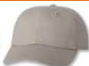
VC6640 Khaki Kaki