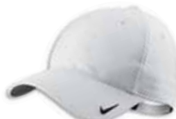
518024 White Blanc