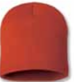
SP08 Blaze Orange Orange