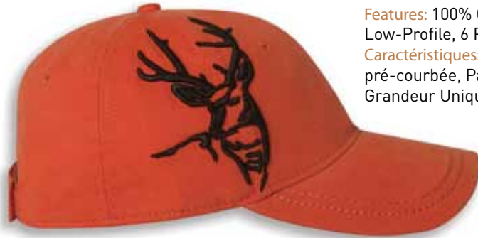
DD3307 BUCK Orange/Bark Orange/Bark

Features: 100% Cotton, Brushed Chino Twill, Unstructured, Brown Undervisor, Low-Profile, 6 Panel, Pre-Curved Visor, Sewn Eyelets, Velcro Closure, One Size Caractéristiques: 100% Coton Brossé Twill, 6 panneaux, Profile bas, Palette pré-courbée, Panneaux avants sans renforcement, Attache arrière en Velcro, Grandeur Unique