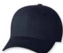
● ● FF5001 Navy Marine