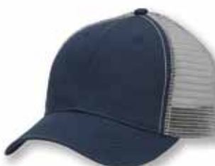
AH80 Navy/Grey Marine/Gris