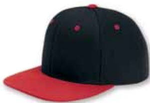
YU6089 Black/Red Noir/Rouge