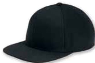
YU6089 Black Noir