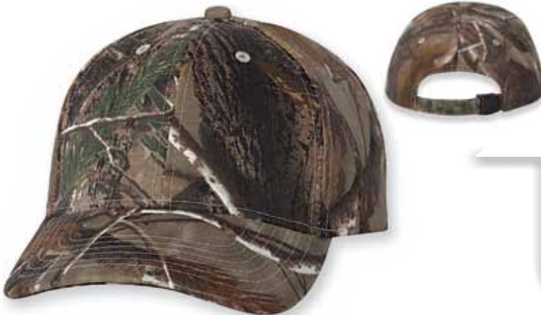
KRT10 REALTREE All Purpose

Features: 60% Cotton / 40% Polyester, Structured, Mid-Profile, Six-panel, Pre-curved Visor, Sewn Eyelets, Flex-Strap, One Size Caractéristiques: 60% Coton 40% Polyester, 6 panneaux, Profile moyen, Palette pré-courbée, Panneaux avants renforcés, Attache arrière Flex-Strap, Grandeur Unique