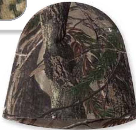
KLCB08 REALTREE All Purpose (AP)