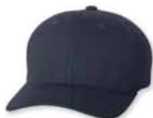
FF6577CD Navy Marine