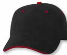
AH36 Black/Red Noir/Rouge

Caractéristiques: 100% Coton Pêche Pré-Lavée Twill, 6 panneaux, Couture Contrastante, Profile Bas, Palette pré-courbée, Panneaux avant sans renforcement, Attache arrière en tissu avec boucle coulissante, Grandeur Unique