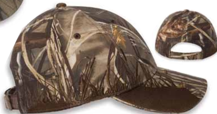
DD3254MAX CAMO MALLARD - Realtree Max4 HD