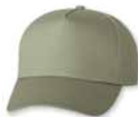
VC8869 Khaki Kaki