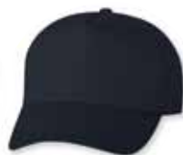
VC8869 Navy Marine