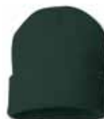
SP12 Forest Green Vert Forêt