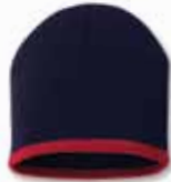
SP09 Navy/Red Marine/Rouge