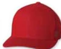
FF6511 Red Rouge