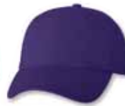
VC300 Purple Mauve