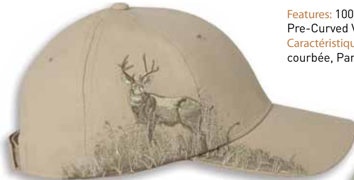
DD3282 MULE DEER Lt Tan / CERF Tan Pâle

Caractéristiques: 100% Coton Brossé Twill, 6 panneaux, Profile moyen, Palette pré-courbée, Panneaux avants renforcés, Attache arrière en Velcro, Grandeur Unique