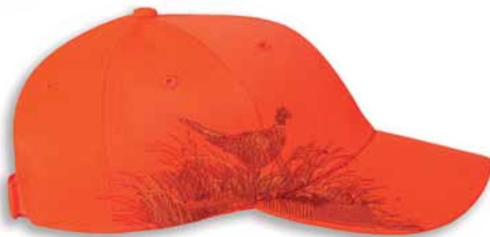
DD3261 PHEASANT Blaze Orange 100% Polyester Blaze Orange