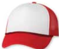
VC700 White/Red Blanc/Rouge