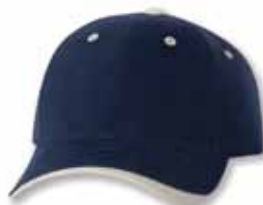
SP9960 Navy/Stone Marine/Pierre