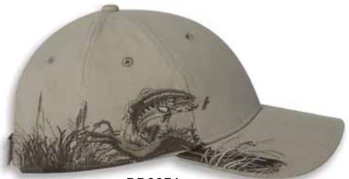
DD3256 TROUT Sand / TRUITE Sable