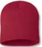
SP08 Red Rouge