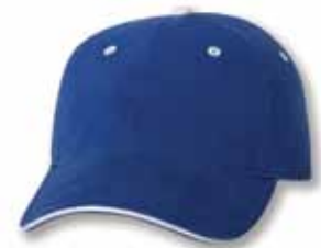
AH36 Royal/White Royal/Blanc