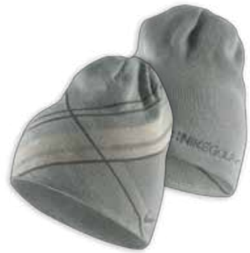
417636 Granite Gris