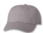
VC6640 Silver Argent