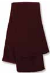
SP04 Maroon Marron