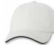
SP2150 White/Black Blanc/Noir