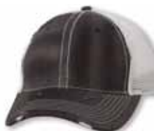
SP3105 Black/Silver Noir/Argent