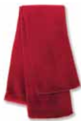
SP04 Red Rouge