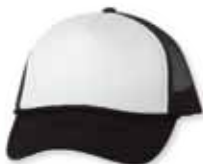
VC700 White/Black Blanc/Noir