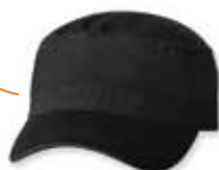
VC800 Black Noir

Caractéristiques: 100% Coton Biologique Pré-Lavé Twill, Forme Militaire "Fidel", Palette pré-courbée, Panneaux avants sans renforcement, Attache arrière avec Velcro, Grandeur Unique