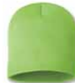
SP08 Neon Green Vert