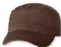
VC800 Brown Brun