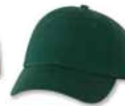
VC300 Forest Green Vert Forêt