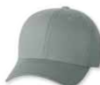
● ● FF5001 Gray Gris