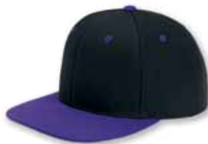
YU6089 Black/Purple Noir/Mauve