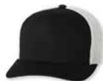
FF6511 Black/White Noir/Blanc