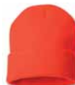
SP12 Blaze Orange Orange