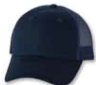
VC400 Navy Marine