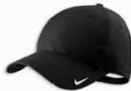
380660 Black Noir