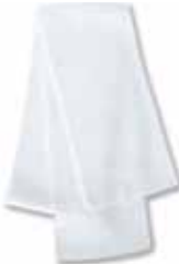
SP04 White Blanc