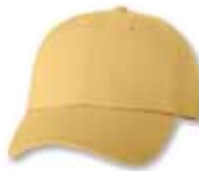
VC300 Butter Buerre