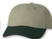
VC6640 Khaki/Forest Khaki/Forêt