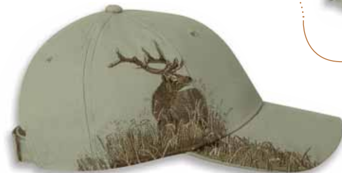
DD3259 ELK Khaki / WAPITI Kaki