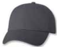
VC300 Charcoal Charbon