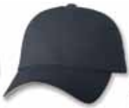
SP2100 Navy/Stone Marine/Pierre