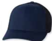
FF6511 Navy Marine