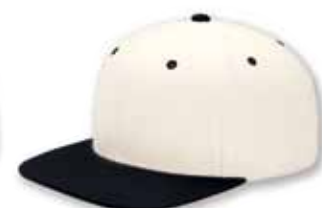
YU6089 Natural Black Noir Naturel