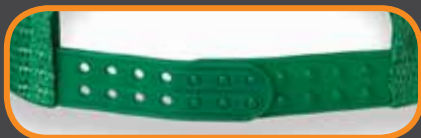
DOUBLE PLASTIC TAB ADJUST/ ATTACHE ARRIÈRE EN PLASTIQUE AJUSTABLE