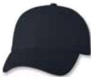
VC300 Navy Marine