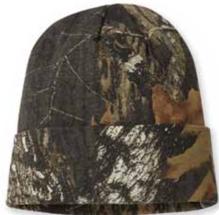
KLCB12 MOSSY OAK Break-Up