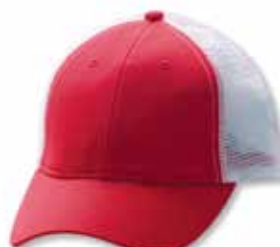
AH80 Red/White Rouge/Blanc