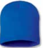
SP08 Royal Royal