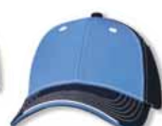
SP9500 Light Blue/Navy Bleu Pâle/Marine