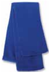
SP04 Royal Royal