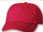
VC6640 Red Rouge