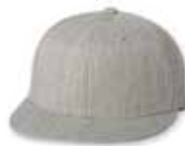
● ● FF6210 Heather Grey Gris Heather