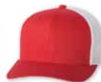
FF6511 Red/White Rouge/Blanc