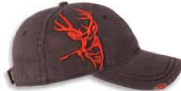
DD3307 BUCK Bark/Orange Bark/Orange