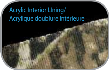
Acrylic Interior Lining/ Acrylique doublure intérieure

Caractéristiques: 60% Coton 40% Polyester, 8" Tricoté, Intérieur en acrylique noir, Grandeur Unique