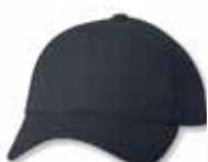
SP2220 Navy Marine