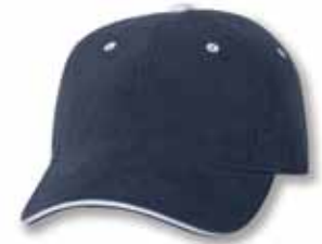
AH36 Navy/White Marine/Blanc