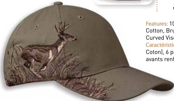
DD3301 BUCK Earth 100% Cotton/Coton Terre

Caractéristiques: 100% Polyester, sauf pour le Buck Earth (100% Cotton), 6 panneaux, Profile moyen, Palette pré-courbée, Panneaux avants renforcés, Attache arrière en Velcro, Grandeur Unique