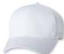
FF6777 White Blanc