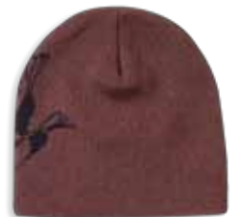
DD3522 MALLARD Tobacco Tobac