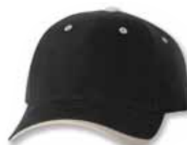
SP9960 Black/Stone Noir/Pierre