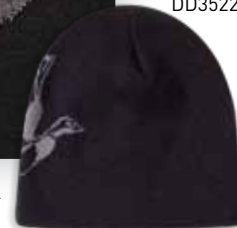
DD3522 MALLARD Black Noir