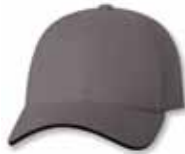
SP2150 Dark Gray/Black Gris Foncé/Noir