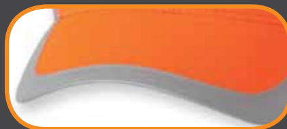
REFLECTIVE TRIM/ BANDE RÉFLECTIVE