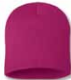
SP08 Neon Fuschia Fuschia