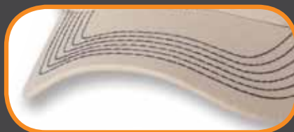
CONTRAST STITCHING/ COUTURES CONTRASTANTES