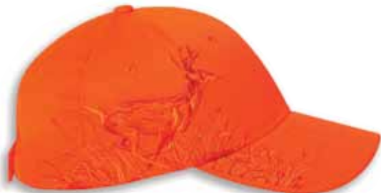
DD3301 BUCK Blaze Orange 100% Polyester Blaze Orange