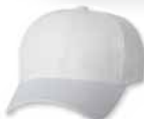
FF6577CD White Blanc