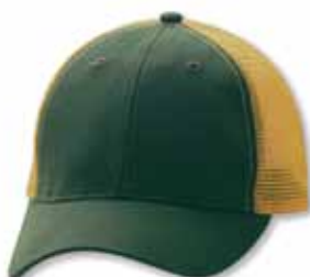
AH80 Forest/Gold Forêt/Or