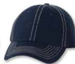
VC300 Navy/Stone Stitch Marine/Coutures Pierre