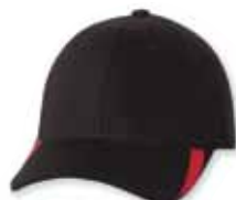
● ● FF5006 Black/Red Noir/Rouge