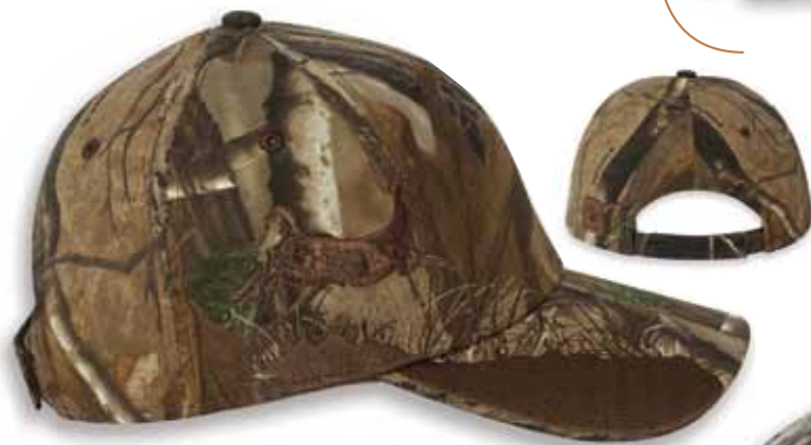
DD3255AP CAMO BUCK - Realtree AP HD