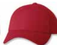
SP2220 Red Rouge