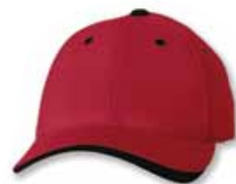
SP9960 Red/Black Rouge/Noir