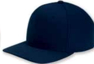
YU6089 Dark Navy Marine