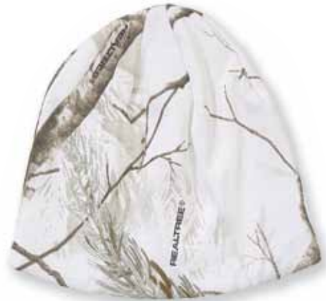
KLCB08 REALTREE All Purpose white (AP White)