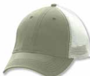
AH80 Brown/Khaki Brun/Kaki