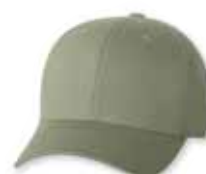
● ● FF5001 Khaki Kaki