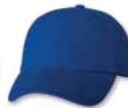
VC300 Royal Royal