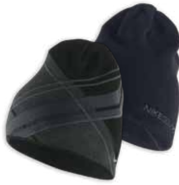
417636 Black Noir