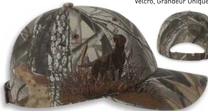
DD3253HD CAMO LABRADOR - Realtree Hardwood HD

Caractéristiques: 55%Coton/45%Polyester, Brossé Twill, 6 panneaux, Profile moyen, Palette pré-courbée, Panneaux avants renforcés, Attache arrière en Velcro, Grandeur Unique