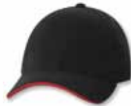
SP2150 Black/Red Noir/Rouge

Caractéristiques: 100% Coton, Chino Twill Brossé, 6 panneaux, Profile moyen, Palette pré-courbée, Sandwich contrastant, Panneaux avants renforcés, Attache arrière en tissu avec boucle coulissante, Grandeur Unique