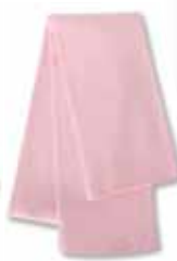
SP04 Pink Rose