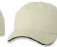
SP2100 Stone/Black Pierre/Noir