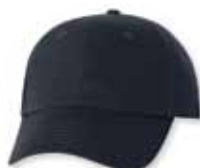
VC600 Navy Marine