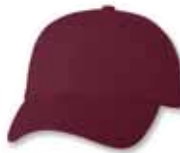
VC300 Maroon Marron