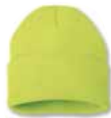
SP12 Safety Yellow Jaune Sécurité