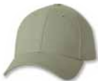
SP9910 Khaki Kaki