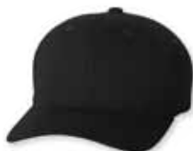
FF6577CD Black Noir