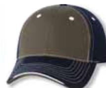
SP9500 Olive/Navy Olive/Marine