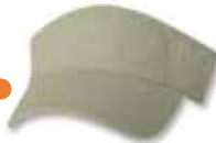
VC500 Khaki Kaki