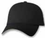
SP2100 Black/Stone Noir/Pierre

Caractéristiques: 100% Coton, Bio-Lavé Chino Twill, 6 panneaux, Profile bas, Palette pré-courbée, Sandwich contrastant, Panneaux avants sans renforcement, Attache arrière en tissu avec boucle coulissante, Grandeur Unique