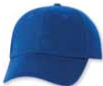
VC600 Royal Royal