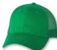
VC400 Kelly Kelly