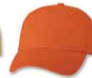
VC300 Orange Orange