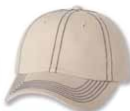
VC300 Stone/Navy Stitch Pierre/Coutures Marines