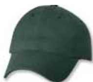
SP9610 Forest Forêt