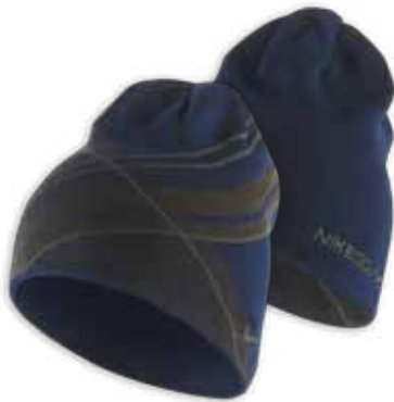
417636 Binary blue Bleu