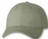
SP2260 Khaki Kaki