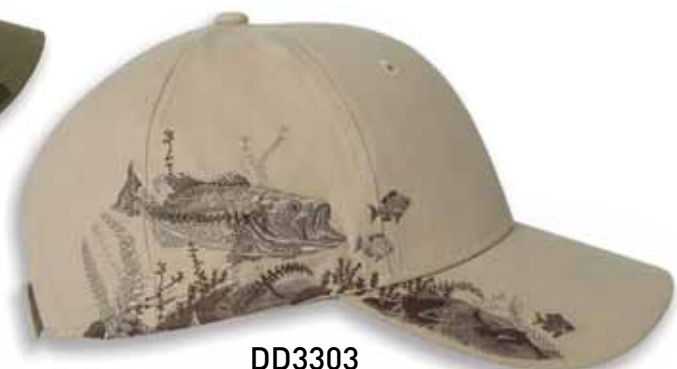
DD3303 BASS Tan / ACHIGAN Tan