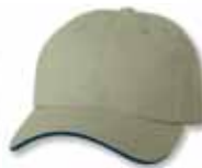
SP2100 Khaki/Navy Kaki/Marine