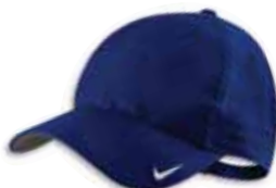
518024 Navy Marine