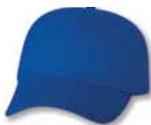
VC100 Royal Royal