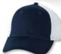
VC400 Navy/White Marine/Blanc