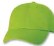
VC300 Neon Green Vert Fluorescent