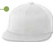
● ● FF6210 White Blanc