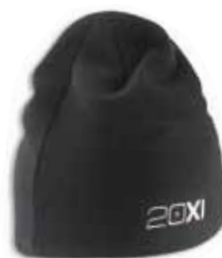
483908 Black Noir