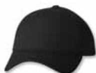
SP2220 Black Noir

Features: 85% Acrylic/ 15% Wool, Structured, Mid-Profile, 6 Panel, Pre-curved, Sewn Eyelets, Velcro Closure, One Size Caractéristiques: 85% Acrylique/ 15% Laine, Chino Twill, 6 panneaux, Palette pré-courbée, Panneaux avants renforcés, Profile moyen, Attache arrière avec Velcro, Grandeur Unique