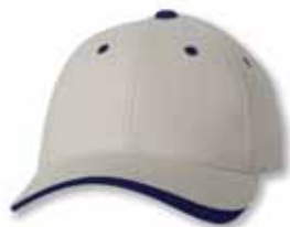
SP9960 Stone/Navy Pierre/Marine