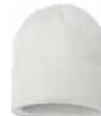
SP12 White Blanc