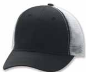
AH80 Black/White Noir/Blanc