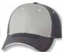
SP9500 Grey/Charcoal Gris/Charbon