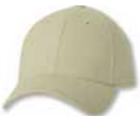
SP9910 Stone Pierre