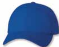
SP2260 Royal Royal