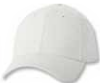
SP9910 White Blanc