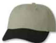
VC6640 Khaki/Black Kaki/Noir