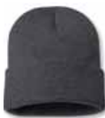
SP12 Charcoal Charbon