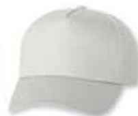
VC8869 White Blanc