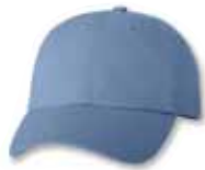
VC300 Sky Blue Bleu Ciel