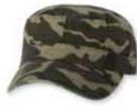
VC800CAM Green Camo Camo Vert

Velcro Closure Attache arrière avec Velcro