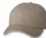
SP2100 Sage/Stone Sage/Pierre