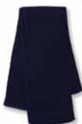
SP04 Navy Marine