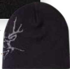
DD3521 BUCK Black Noir