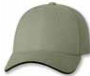
SP2150 Khaki/Forest Kaki/Forêt