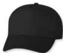
VC8869 Black Noir