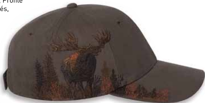
DD3295 MOOSE Brown Brun