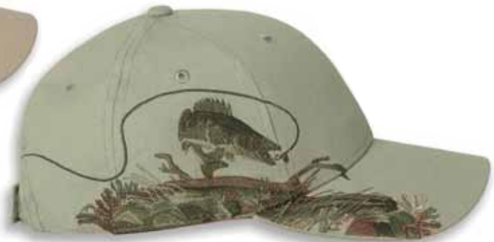
DD3269 WALLEYE Dark Khaki / DORÉ Kaki Foncé