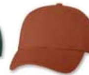
VC300 Texas Orange Orange Texas