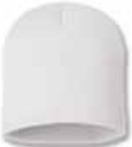
SP08 White Blanc