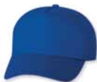
VC8869 Royal Royal