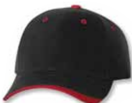
SP9960 Black/Red Noir/Rouge