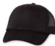
VC700 Black Noir