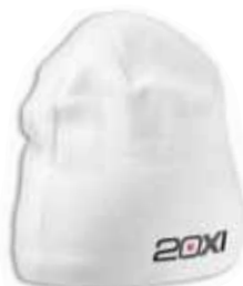
483908 White Blanc

Caractéristiques: Tuque authentique de tournoi en tricot. 100% polyester. Grandeur Unique.