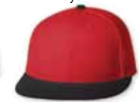
● ● FF6210 Red/Black Rouge/Noir