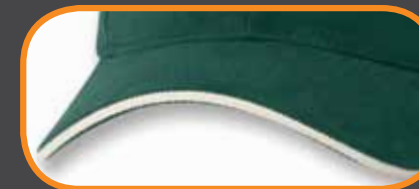
CONTRASTING SANDWICH/ SANDWICH CONTRASTANT