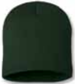
SP08 Forest Green Vert Forêt