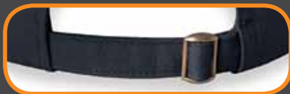
TRI-GLIDE BUCKLE CLOSURE/ ATTACHE ARRIÈRE AVEC BOUCLE COULISSANTE