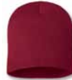
SP08 Cardinal Cardinal