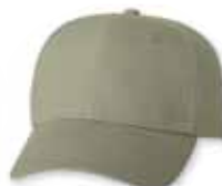
VC600 Khaki Kaki