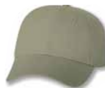
VC100 Khaki Kaki