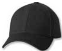
SP9910 Black Noir