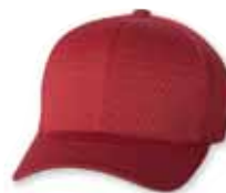
FF6777 Red Rouge