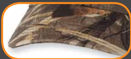
LICENSED CAMO/ CAMO