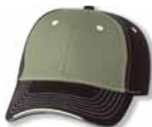
SP9500 Khaki/Black Kaki/Noir