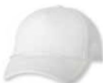
VC700 White Blanc