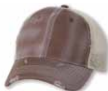
SP3105 Fatigue/Khaki Fatigue/Kaki