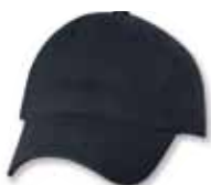
SP9610 Navy Marine