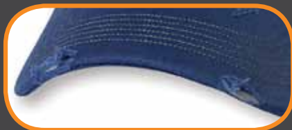
FRAYED PEAK/ PALETTE EFFILOCHÉE