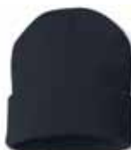
SP12 Navy Marine