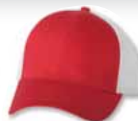
VC400 Red/White Rouge/Blanc