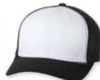
FF6511 White/Black Blanc/Noir