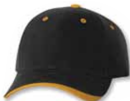
SP9960 Black/Gold Noir/Or