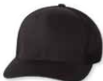
FF6511 Black Noir

Caractéristiques: 55% Polyester/43% Coton/2% Spandex, 100% Polyester Mesh arrière, Profile-Bas, 6 Panneaux, Permacurv, Grandeur Unique 6 7/8" - 7 1/2"