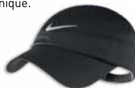
381894 Black Noir

Caractéristiques: Casquette de golf ajustable. Tissu Storm Fit qui respire et est imperméable. Logo sur le devant. Fermeture arrière en velcro. Grandeur Unique.