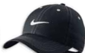
518640 Black Noir