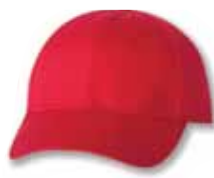
VC100 Red Rouge