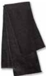
SP04 Charcoal Charbon