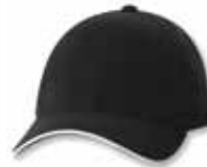
SP2150 Black/Natural Noir/Pierre