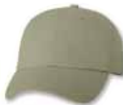
VC300 Khaki Kaki