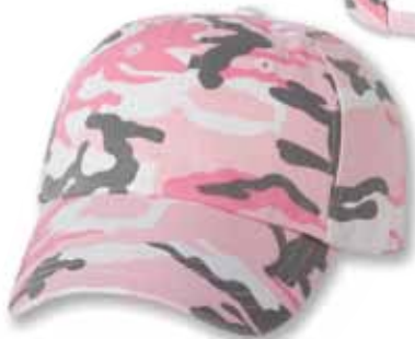
VC300CAM Pink Rose

Caractéristiques: 100% Coton Biologique lavé Chino Twill, 6 panneaux, Profile Bas, Palette pré-courbée, Panneaux avants sans renforcement, Attache arrière en tissu avec boucle coulissante, Grandeur Unique