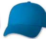
VC300 Neon Blue Bleu Fluorescent