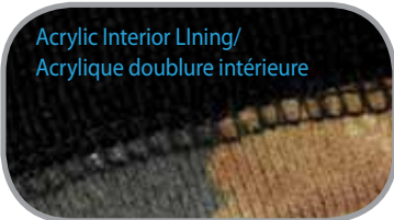
Acrylic Interior Lining/ Acrylique doublure intérieure

Caractéristiques: 60% Coton 40% Polyester, 12" Tricoté, Intérieur en acrylique noir, Grandeur Unique