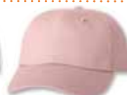
VC6640 Pink Rose