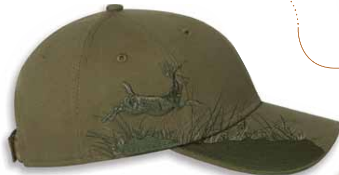
DD3255 BUCK Olive / CERF MÂLE Olive