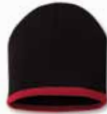
SP09 Black/Red Noir/Rouge