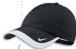
518023 Black Noir

Caractéristiques: Silhouette légèrement structurée. Fermeture arrière anti-accros. Casquette à panneau avant vierge où on peut ajouter un écusson. 2,95 oz. Dri-FIT 100% polyester. Grandeur Unique.