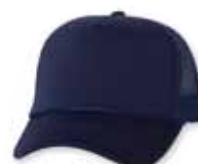
VC700 Navy Marine