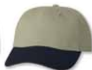
VC6640 Khaki/Navy Khaki/Marine