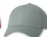
SP2220 Grey Gris