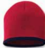
SP09 Red/Navy Rouge/Marine