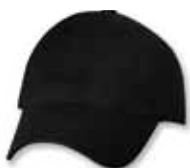
SP9610 Black Noir