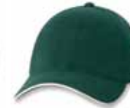
SP2150 Forest/Natural Forêt/Neutre