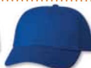
VC6640 Royal Royal