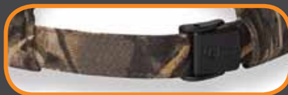
FLEX-STRAP ATTACHE ARRIÈRE FLEX-STRAP