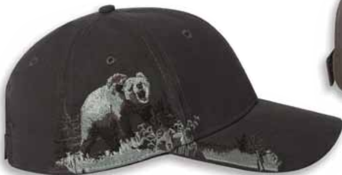
DD3319 GRIZZLY BEAR Charcoal Charbon

Caractéristiques: 100% Coton Brossé Twill, 6 panneaux, Profile moyen, Palette pré-courbée, Panneaux avants renforcés, Attache arrière en Velcro, Grandeur Unique