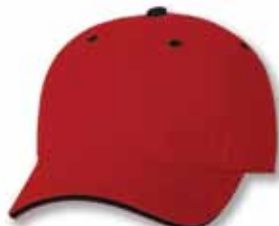
AH36 Red/Black Rouge/Noir