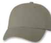
VC300 Olive Olive