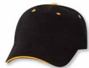
AH36 Black/Gold Noir/Or