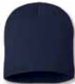
SP08 Navy Marine