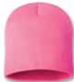
SP08 Neon Pink Rose