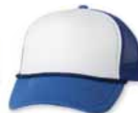
VC700 White/Royal Blanc/Royal