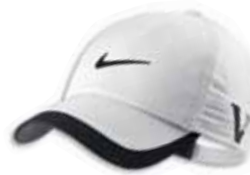
510638 White Blanc