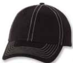
VC300 Black/Stone Stitch Noir/Coutures Pierre