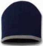
SP09 Navy/Grey Marine/Gris