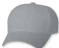
FF6577CD Grey Gris