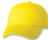
VC300 Neon Yellow Jaune Fluorescent