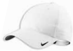
401411 White Blanc