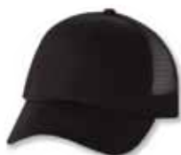
VC400 Black Noir