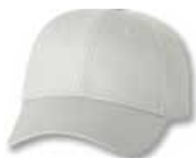
VC100 White Blanc