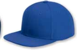
YU6089 Royal Royal