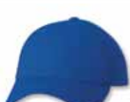
SP2220 Royal Royal