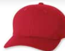
FF6577CD Red Rouge