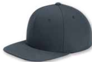
YU6089 Dark Gray Gris Foncé