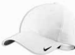
380660 White Blanc