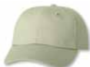
VC6640 Stone Pierre