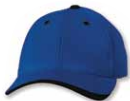
SP9960 Royal/Black Royal/Noir