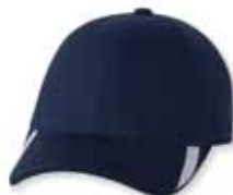
● ● FF5006 Navy/White Marine/Blanc