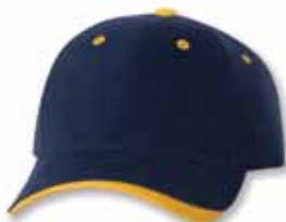
SP9960 Navy/Gold Marine/Or