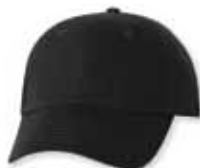
VC600 Black Noir