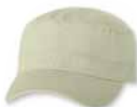
VC800 Stone Pierre