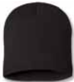
SP08 Black Noir