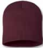
SP08 Maroon Marron