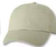
VC300 Stone Pierre