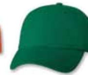
VC300 Kelly Green Vert Kelly