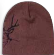
DD3521 BUCK Tobacco Tobac