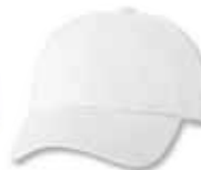
VC300 White Blanc