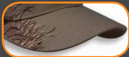
WILDLIFE EMBROIDERY/ BRODERIE WILDLIFE