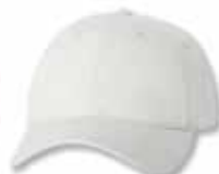
SP2260 White Blanc