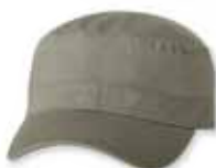
VC800 Olive Green Vert Olive