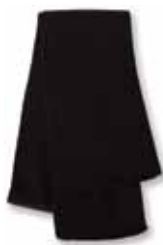
SP04 Black Noir

Features: 100% Acrylic, Knit, 69" Length, 7 1/4" Width, One Size Caractéristiques: 100% Acrylique, Tricoté, 69" X 7 1/4" largeur, Grandeur Unique