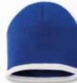
SP09 Royal/White Royal/Blanc