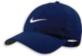
518015 College Navy Marine

Snagless back closure Fermeture arrière anti-accros