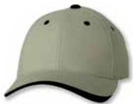
SP9960 Khaki/Black Kaki/Noir