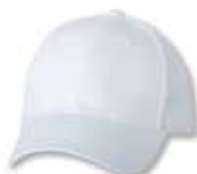
VC400 White Blanc