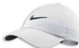
518017 White Blanc