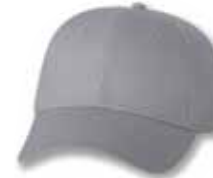
VC100 Grey Gris