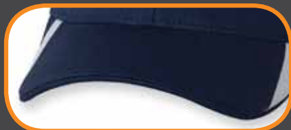
SIDE INSERTS/ INSERTION DE TISSU