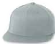
● ● FF6210 Grey Gris