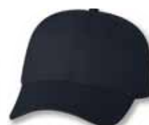
VC100 Navy Marine