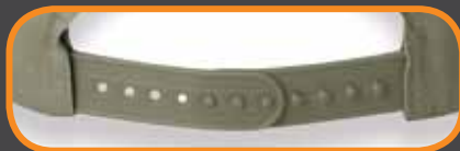
PLASTIC TAB ADJUST/ ATTACHE ARRIÈRE EN PLASTIQUE AJUSTABLE