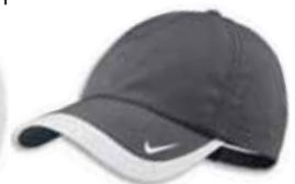
518023 Dark Grey Gris Foncé