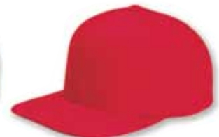
YU6089 Red Rouge