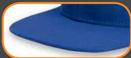
FLAT PEAK/ PLALETTE PLATE