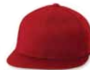
● ● FF6210 Red Rouge