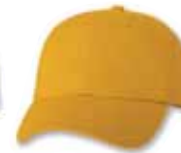
VC300 Gold Or