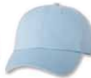
VC300 Baby Blue Blue Bébé