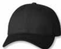
SP2260 Black Noir