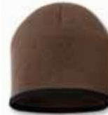
SP09 Saddle/Black Saddle/Noir