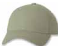
SP2220 Khaki Kaki