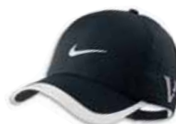
510638 Black Noir