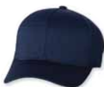
FF6777 Navy Marine