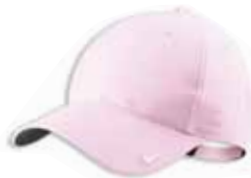
380660 Pink Rose