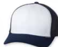
FF6511 White/Navy Blanc/Marine