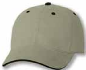
AH36 Khaki/Black Kaki/Noir