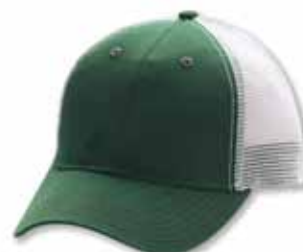
AH80 Forest/White Forêt/Blanc