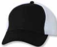
SP3200 Black/White Noir/Blanc