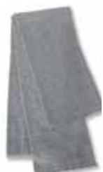
SP04 Grey Gris