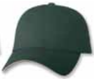
SP2100 Forest/Stone Sage/Forêt