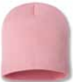
SP08 Pink Rose