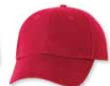
VC600 Red Rouge