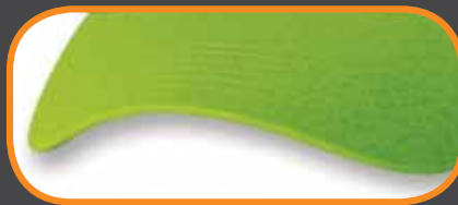
REGULAR SANDWICH/ SANDWICH RÉGULIER