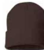
SP12 Brown Brun