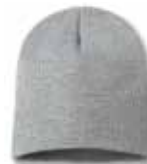
SP08 Grey Heather Gris