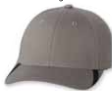
● ● FF5006 Gray/Black Gris/Noir