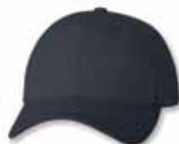
SP2260 Navy Marine