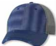
SP3105 Ocean/Sage Océan/Sage