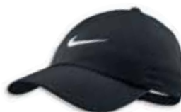
518017 Black Noir

Caractéristiques: Silhouette légèrement structurée et fermeture ajustable à l'arrière. 2,95 oz. indéchirable Dri-FIT 100% polyester. Grandeur Unique.