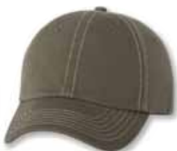
VC300 Olive/Stone Stitch Olive/Coutures Pierre