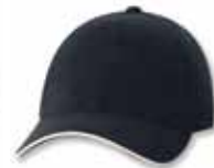
SP2150 Navy/Natural Marine/Neutre