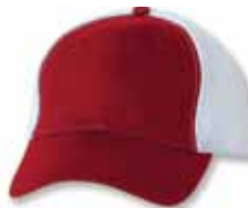
SP3200 Red/White Rouge/Blanc