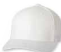
● ● FF5001 White Blanc