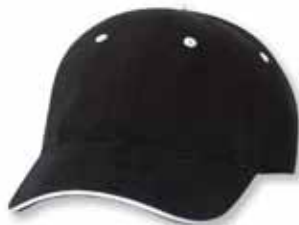
AH36 Black/White Noir/Blanc