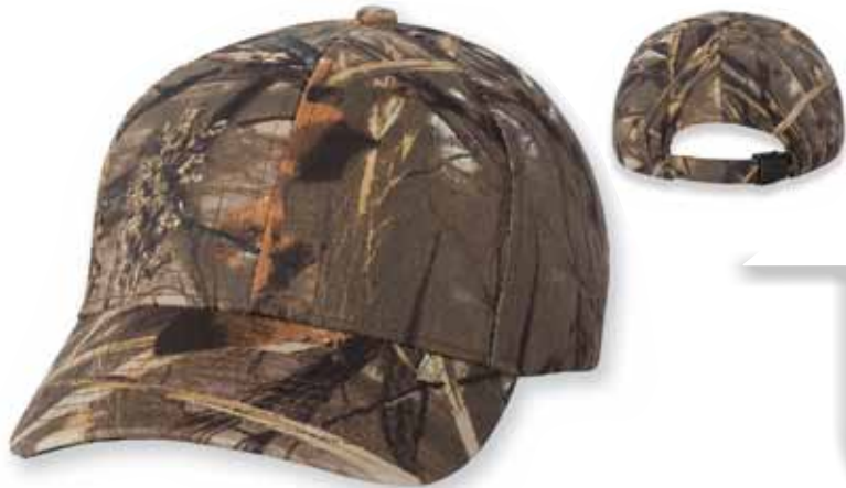
KAD10 REALTREE Max4