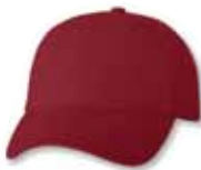
VC300 Cardinal Cardinal