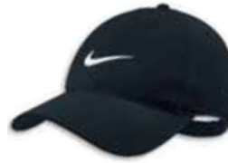
518015 Black Noir