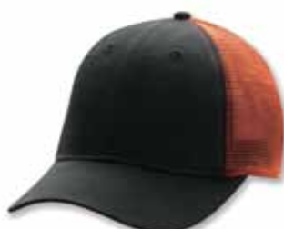
AH80 Black/Orange Noir/Orange