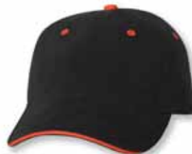
AH36 Black/Orange Noir/Orange