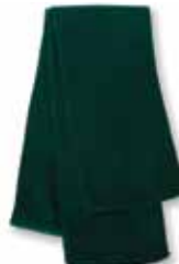
SP04 Forest Green Vert Forêt