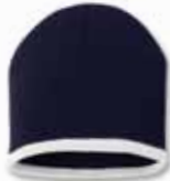
SP09 Navy/White Marine/Blanc