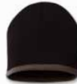
SP09 Black/Taupe Noir/Rouge