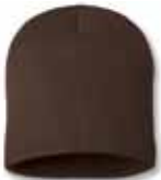
SP08 Brown Brun