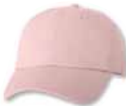
VC300 Lt. Pink Rose Pâle