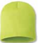
SP08 Safety Yellow Jaune Sécurité