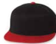
● ● FF6210 Black/Red Noir/Rouge