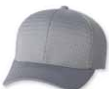
FF6777 Silver Argent