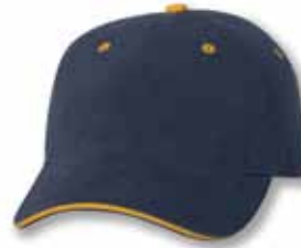
AH36 Navy/Gold Marine/Or