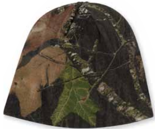
KLCB08 MOSSY OAK Break-Up