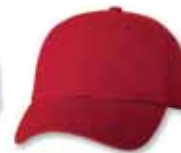
VC300 Red Rouge