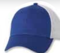
SP2220 Royal/White Royal/Blanc