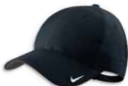
518024 Black Noir