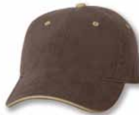
AH36 Brown/Khaki Brun/Kaki