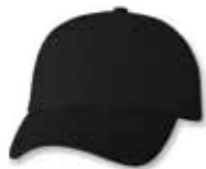
VC300 Black Noir