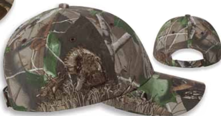
DD3258HG CAMO TURKEY - Realtree Hardwood Green