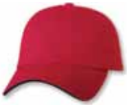
SP2100 Red/Navy Rouge/Marine