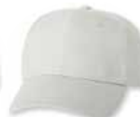
VC600 White Blanc