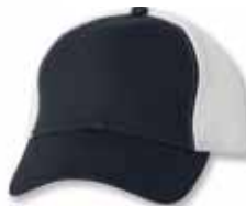
SP3200 Navy/White Marine/Blanc