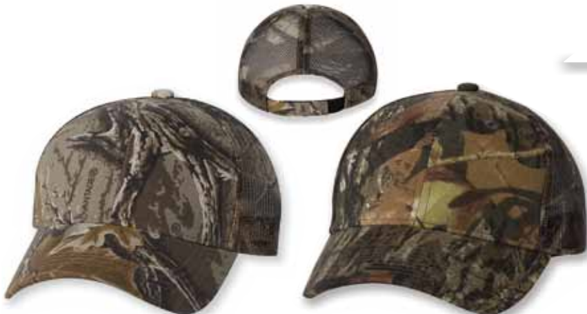
OC415PC Advantage Classic

Features: 60% Cotton / 40% Polyester, Brushed Twill, Structured, Mid-Profile, Six-panel, Black Undervisor, Pre-curved Visor, Sewn Eyelets, Velcro Closure, One Size Caractéristiques: 60% Coton Brossé, 40% Polyester, 6 panneaux, Profile moyen, Palette pré-courbée, Palette Harmonisée, Panneaux avants renforcés, Attache arrière en Velcro, Grandeur Unique