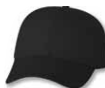
VC100 Black Noir