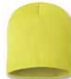
SP08 Neon Yellow Jaune