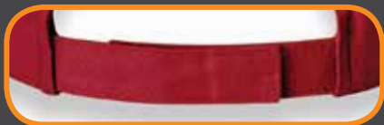
VELCRO CLOSURE ATTACHE AVEC VELCRO