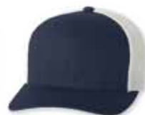
FF6511 Navy/White Marine/Blanc