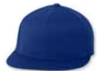
● ● FF6210 Royal Royal