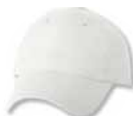
SP9610 White Blanc