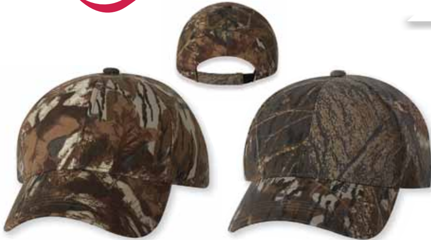
OC401PC Advantage Classic