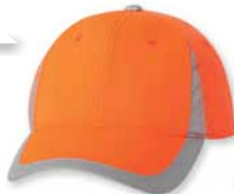
OSAF100 Blaze Orange Orange

Caractéristiques: 100% Polyester, Orné d'une bande réfléchive, 6 panneaux, Palette pré-courbée, Panneaux avants renforcés, profile Moyen-Bas, Attache arrière en Velcro, Grandeur Unique