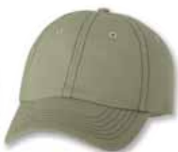
VC300 Khaki/Brown Stitch Kaki/Coutures Brunnes