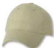
SP9610 Stone Pierre

Caractéristiques : 100% Coton Brossé Twill, 6 panneaux, Profile Bas, Palette pré-courbée, Panneaux avants sans renforcement, Attache arrière en tissu avec boucle coulissante, Grandeur Unique