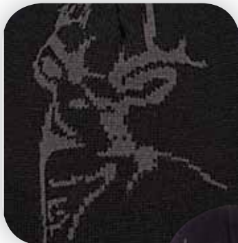
DD3521 BUCK Detail

Caractéristiques: 100% Acrylique, 8½" Style, tricot Jacquard, Scène d'animaux, Grandeur Unique