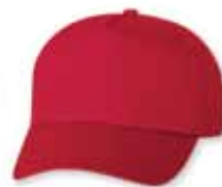
VC8869 Red Rouge