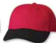
VC6640 Red/Black Rouge/Noir