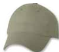
SP9610 Khaki Kaki