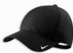
401411 Black Noir