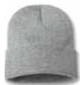
SP12 Grey Heather Gris