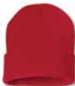
SP12 Red Rouge