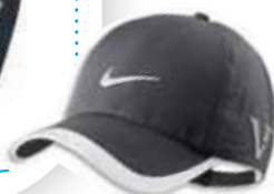
510638 Dark Grey Gris foncé

Caractéristiques: Silhouette légèrement structurée. Fermeture arrière anti-accros. Casquette authentique de tournoi. 2,95 oz. façonné Dri-FIT 100% polyester. Grandeur Unique.