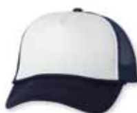
VC700 White/Navy Blanc/Marine