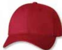
SP2260 Red Rouge