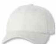
SP2220 White Blanc