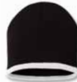
SP09 Black/White Noir/Blanc