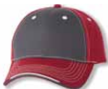
SP9500 Charcoal/Red Charbon/Rouge

Caractéristiques: 100% Coton Chino Twill, 6 panneaux, Profile Medium, Palette pré-courbée, Panneaux avants renforcés, Attache élastique avec Velcro, Sandwich contrastant, Grandeur Unique