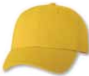
VC300 Yellow Jaune