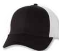
VC400 Black/White Noir/Blanc