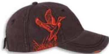
DD3308 MALLARD Bark/Orange Bark/Orange