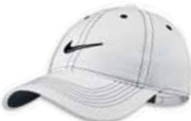
518640 White Blanc