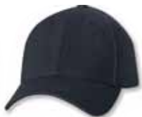
SP9910 Navy Marine