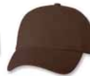
VC300 Brown Brun