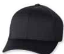
FF6777 Black Noir

Caractéristiques: 97% Polyester/3% Spandex, 6 panneaux, Profile moyen, Palette pré-courbée, Panneaux avants renforcés, Mesh Athlétique, Grandeur Unique 6 7/8" - 7 3/8"