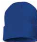
SP12 Royal Royal