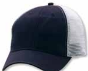
AH80 Navy/White Marine/Blanc