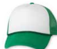
VC700 White/Kelly Blanc/Kelly