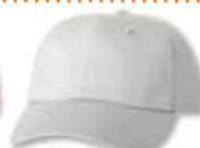
VC6640 White Blanc