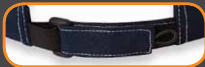
ELASTIC VELCRO CLOSURE ATTACHE ÉLASTIQUE AVEC VELCRO