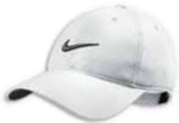
518015 White Blanc

Caractéristiques: Silhouette légèrement structurée. Fermeture arrière anti-accros. 3,25 oz. indéchirable Dri-FIT 100% polyester. Grandeur Unique.