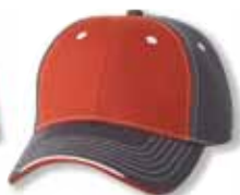
SP9500 Orange/Charcoal Orange/Charbon