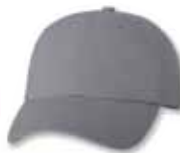
VC300 Grey Gris