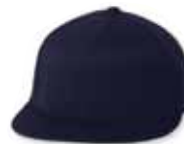
● ● FF6210 Dark Navy Marine Foncé