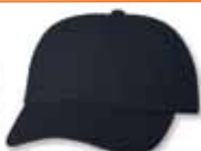
VC6640 Navy Marine