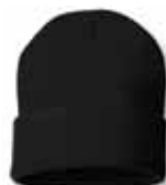
SP12 Black Noir

Features: 100% Acrylic, Knit, 12" Style, One Size Caractéristiques: 100% Acrylique, Tricoté, 12" Grandeur Unique