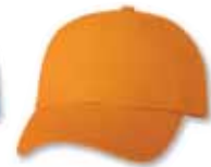
VC300 Neon Orange Orange Fluorescent