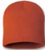
SP08 Orange Orange