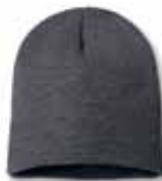
SP08 Charcoal Charbon